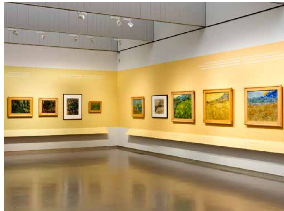
tentoonstellingen / exhibitions

De Gulden Boekers van het echtpaar Kröller-Müller doneerden jaarlijks aan het museum. Nu kunt u zelf lid worden van zo'n exclusief gezelschap van begunstigers door Gulden Boeker, Zilveren Boeker of Bronzen Boeker te worden.