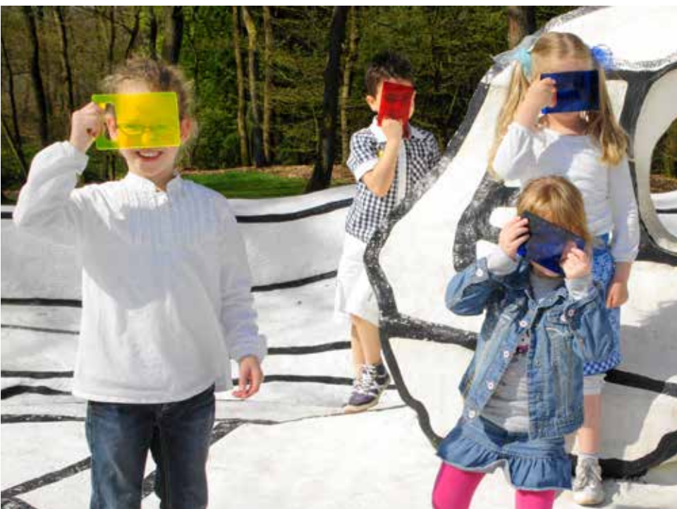
educatie / education